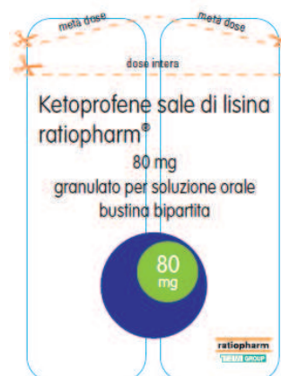
Figura 2: Etichetta corretta

Il paziente, nell'utilizzare il farmaco con tale etichettatura errata, può essere indotto ad utilizzare una sola mezza busta pensando di assumere 80 mg, mentre ne assume 40 mg.